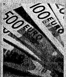
NAJVIŠE JE KORUMPIRANO PRAVOSUDE. SMATRA 57% GRADANA HRVATSKE